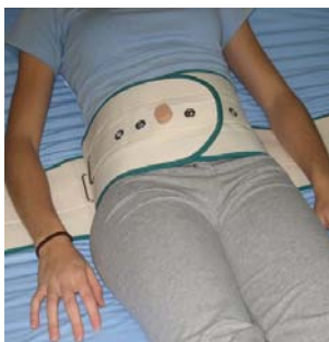
Cinturón magnético para cama