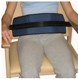
Cinturón de silla

JJGARCIA TFNO 636 377 600 email: jjgarcia40@gmail.com