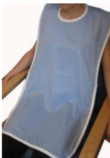
Babero de POLIURETANO